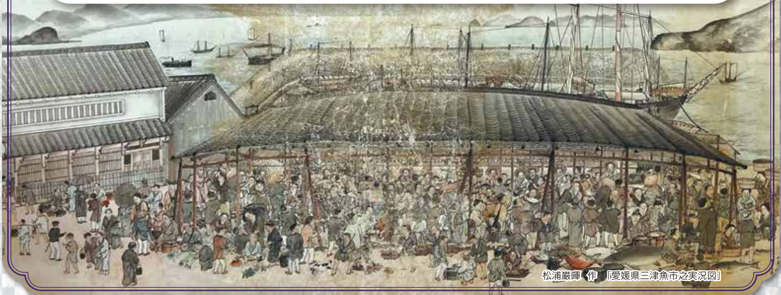
松浦巖暉 作 「愛媛県三津魚市之実況図」